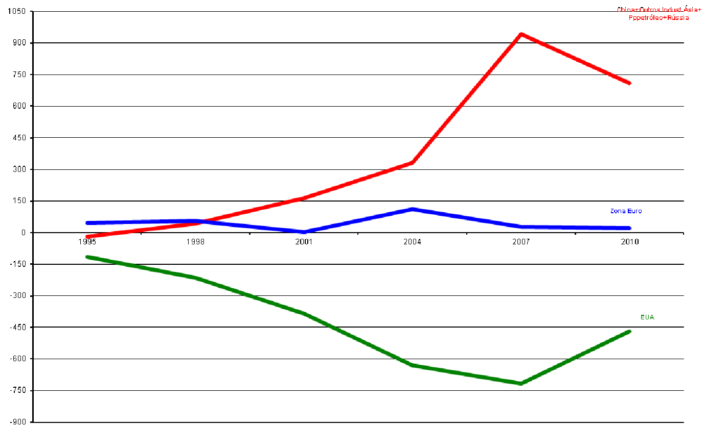
G. 2 - Balanças de Transacções Correntes (bilhões de dólares)